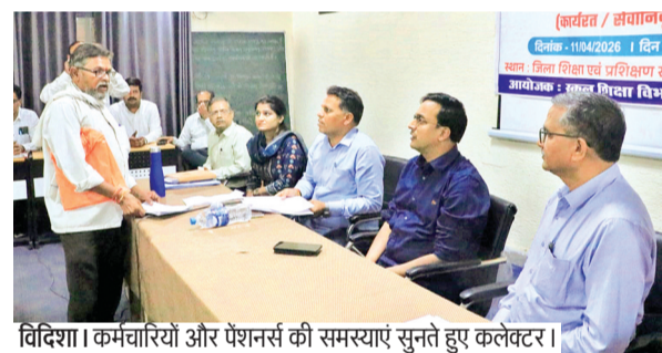
विदिशा। कर्मचारियों और पेंशनरों की समस्याएं सुनते हुए कलेक्टर।

शिविर में शिक्षकों, कर्मचारियों तथा पेंशनरों ने वेतन विसंगति, पेंशन प्रकरण, सेवा पुस्तिका सुधार, लॉन्ग एरियर भुगतान, पदोन्नति, अवकाश स्वीकृति सहित अन्य प्रशासनिक विषयों से संबंधित आवेदन प्रस्तुत किए। कुल 45 आवेदन प्राप्त हुए, जिनमें से 12 प्रकरणों का मौके पर ही निराकरण कर दिया गया। शेष आवेदनों के शीघ्र समाधान के लिए संबंधित