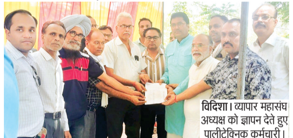
विदिशा। व्यापार महासंघ अध्यक्ष को ज्ञापन देते हुए पालीटेक्निक कर्मचारी।