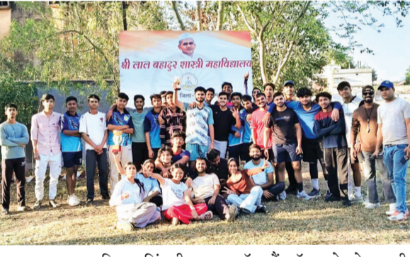
फाइनल मुकाबला मिल्खा सिंह टीम और मेजर ध्यानचंद टीम के मध्य हुआ। जिसमें फाइनल मुकाबला 15-25 से मेजर ध्यानचंद टीम ने लुगट से जीता। सभी खिलाड़ियों ने अपना दमखम प्रतियोगिता में दिखाया। खिलाड़ी मोबाइल की दुनिया से बाहर आए और खेल मैदान में अपना दमखम दिखाया, जब तक प्रतियोगिता चलती रही किसी भी खिलाड़ी ने ज्यादा मोबाइल नहीं चलाया। इस उद्देश्य ये मुहिम चालू की गई है। आगे और भी प्रतियोगिता