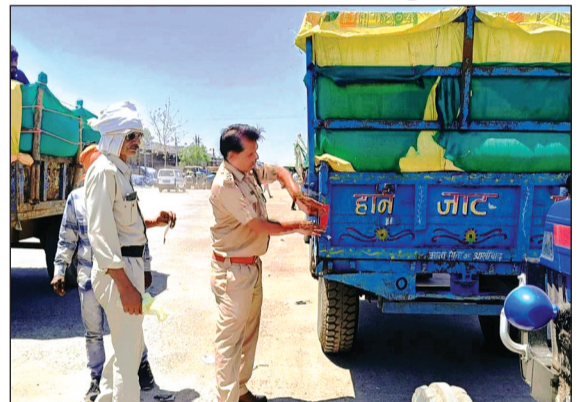
नियमों का पालन करने, वाहन तेज गति से न चलाने, नशा कर वाहन न चलाने, नाबालिगों को वाहन न देने, ओवरलोड सवारी न बिठाने, दो पहिया वाहन न हेलमेट लगाने, चार पहिया वाहन सीट बेल्ट लगाकर चलाने की समझाइश दी।