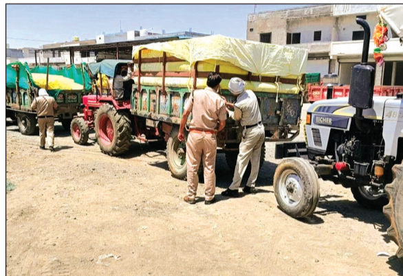
बताया कि जागरूकता अभियान के तहत कृषि उपज मण्डी में मौजूद किसानों को राहवीर योजना, केशलेस उपचार योजना एवं हिट एंड रन पीडित प्रतिकर योजना को लेकर जागरूक किया गया। मण्डी में आए किसानों को यातायात