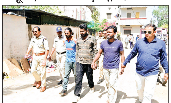
विदिशा। आरोपियों को गिरफ्तार कर पुलिस ने निकाला जुलूस।